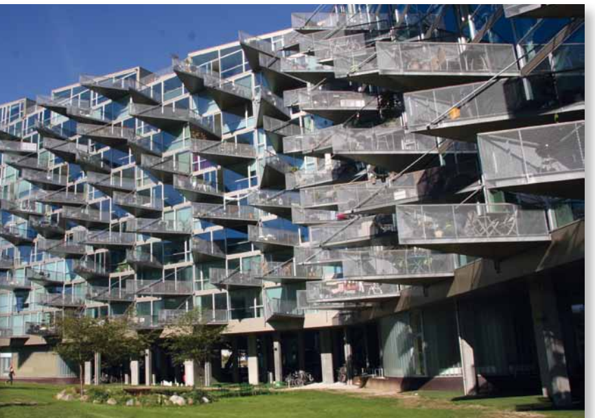
ArchitekTour Kopenhagen: VM Häuser von Bjarke Ingels.

Im Herbst gibt es immer eine neue ArchitekTour, die im Frühjahr wiederholt wird.