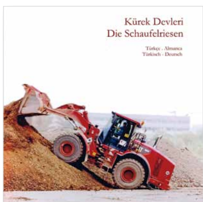
Zum Spracherwerb angelegt sind die „Schaufelriesen“.

Mithilfe von Bagger und Radlader Wortschatz aufbauen