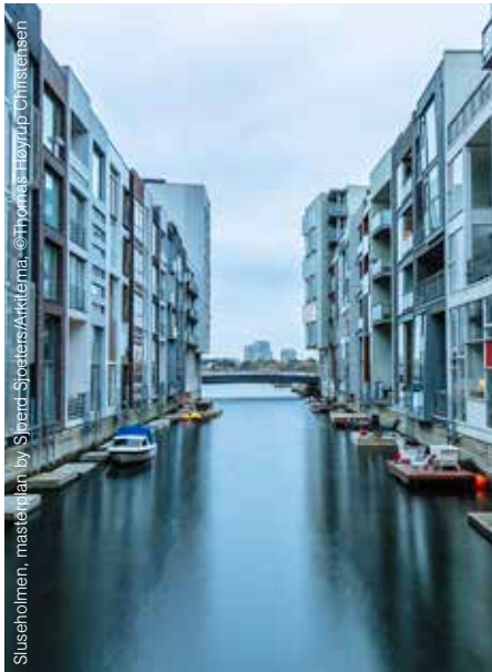
Sluseholmen, masterplan by Sjoerd Spieeters/Arkitema